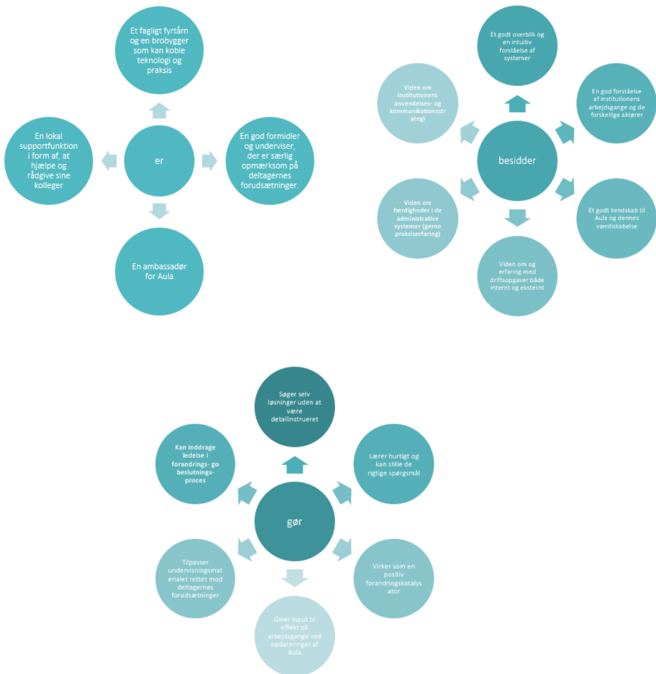
Figur 2: Pejlemærker ifm. udvælgelse af superbruger for pædagogisk personale